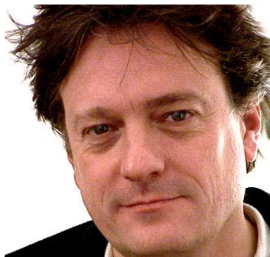
T. De Mey © D.R.

2005. La chaîne ARTE a diffusé 3 de ses films en avril 2005. En juillet 2005, il a été nommé dans le quatuor de direction artistique de Charleroi/Danses, Centre chorégraphique de la Communauté française.